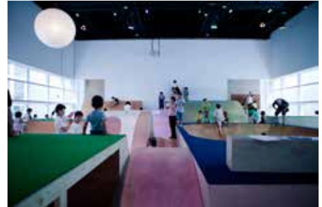
「コロガル公園」の様子(2012)

情報社会への関心やリテラシーの普及・拡大を目指した、YCAMの様々な教育普及活動を体験可能にする「YCAMサマースクール」や、2012年の夏、坂本龍一氏を講師に迎え市内の小学生に向けて開催した、音と空間の関係性を学ぶYCAMオリジナルワークショップ「walking around surround」を発展させ展開します。また、2012年YCAM館内に登場し、多くの子ども達が集う遊び場となった成長する公園「コロガル公園」のコンセプトを発展させた屋外型のコロガル公園＝「コロガルパビリオン」を展開します。