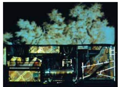
招聘作品『ハイナー・ゲッベルス「Stifers Dinge (シュティフターズ・ディンゲ)」』

これまでYCAMが、メディアと身体の関係性から追求してきたパフォーマンスの試みをベースに、参加型のアウトドアプロジェクトを開催するほか、記念祭のテーマに呼応し、国際的に高い評価を受ける質の高い海外作品の招聘、そして野外能楽堂の貴重な保存例にも挙げられる山口市野田神社能楽堂を使用したパフォーマンスの上演を行います。