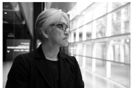
YCAM10周年記念祭アーティストックディレクター: 坂本龍一氏