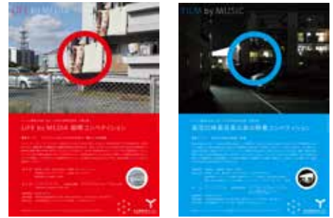
公募企画チラシ (AD: 大西隆介)

YCAMの拠点となる山口市と一体となって取り組む事業の1つとしてYCAM初の公募展示を開催。「シェア」や「ノマド」「モバイル」など近年変わりつつある「生き方」「暮らし方」の未来を問うプランを募集する「LIFE by MEDIA 国際コンペティションーメディアによるこれからの生き方・暮らし方の提案」と、映画音楽へ焦点を当てた映像コンペティション「架空の映画音楽の為に映像コンペティション」の2つを開催。受賞作品や優秀作品は記念祭期間中、街中での展示、展開を予定しています。