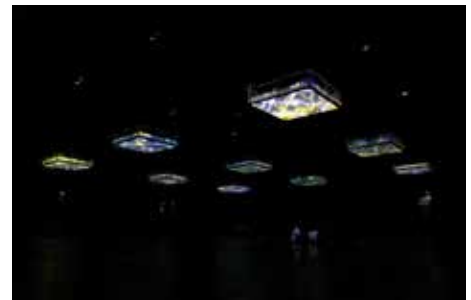
坂本龍一＋高谷史郎「LIFE - fluid, invisible, inaudible...」 (2007)

YCAMの活動の軸の1つであるメディアテクノロジーの可能性の追求と、情報化社会と芸術の関係を探求するための国際的なグループ展を開催する他、森林や樹木に深い興味を抱いてきた坂本龍一氏が、東日本大震災以降、その関心を具体的な芸術表現として示した「Forest Symphony」プロジェクトをYCAM InterLabとの共同制作によって新たに展開します。また、2007年にYCAMで発表し国内外各地を巡回してきた、インスタレーション作品、坂本龍一＋高谷史郎「LIFE - fluid, invisible, inaudible...」の新バージョンを含めた再展示や、坂本龍一氏の新作の制作・展示を行います。